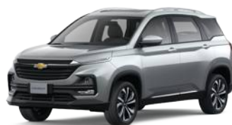
77U (Aurora Silver)