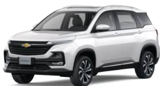
GSB (Polar white)