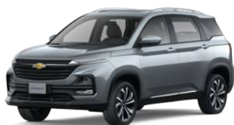
GIR (Tuungsten Grey)