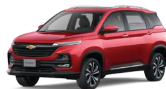
JOU (Glaze Red)