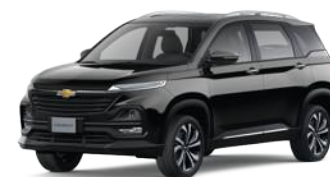
GBA (Star Twinkle Black)