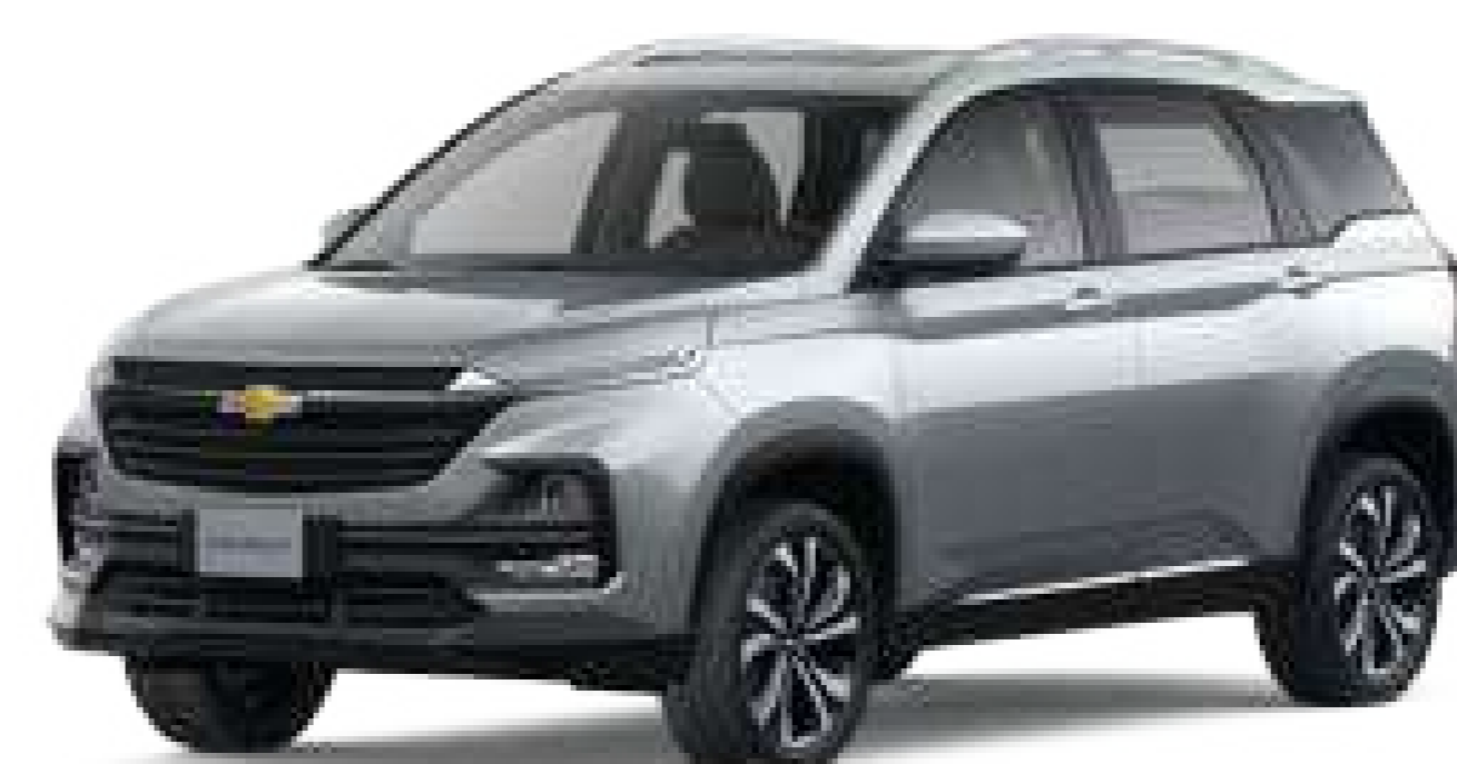
77U (Aurora Silver)