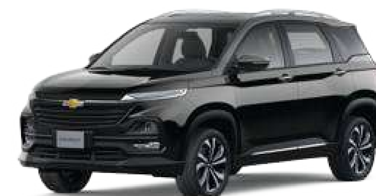
GBA (Star Twinkle Black)