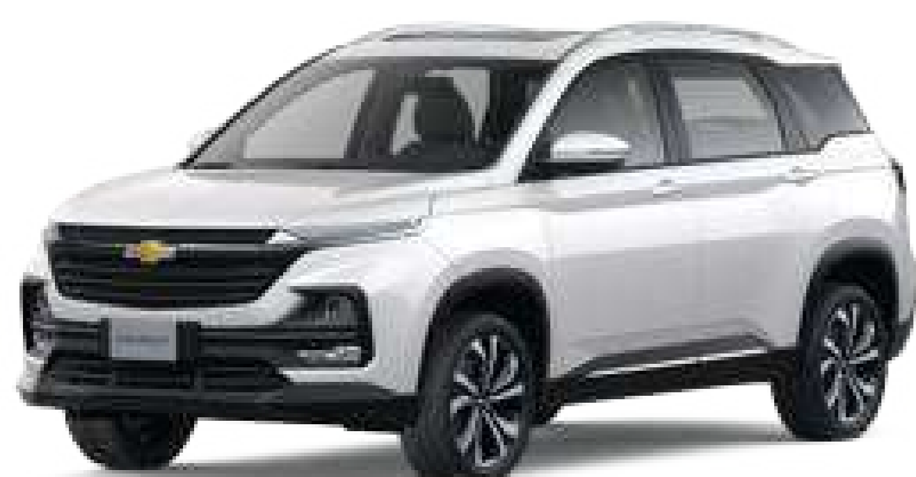
GSB (Polar white)