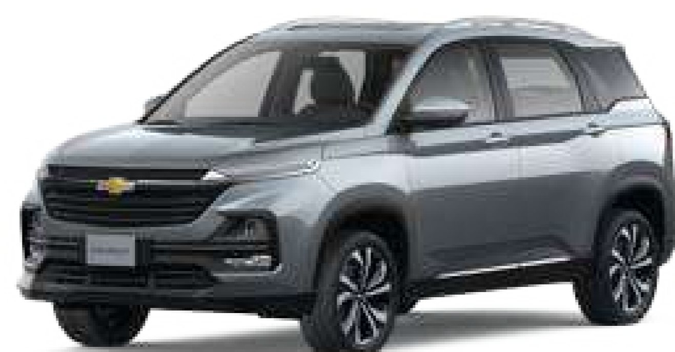
GIR (Tuungsten Grey)